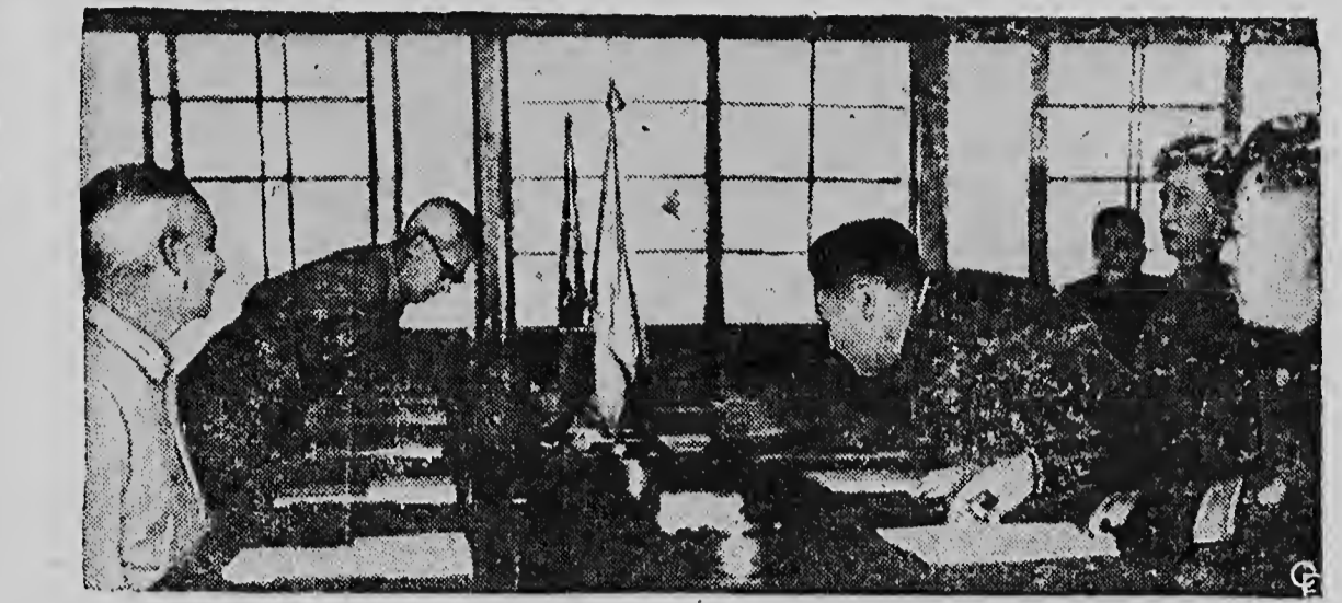
DEZE FOTO VAN DE GEDLEGDE, die in Pan Mun Jon de laatste maanden aan een verhandsovereenkomst. Links de geallieerde (linker) en de Koreaanse afgevaardigde rechts de communisten. Vanmorgen werden de besprekingen verdaagd, zonder dat een nieuwe bijeenkomst werd uitgeschreven. De experts „moeten de details regelen“...of staan de besprekingen opnieuw voor een impasse?